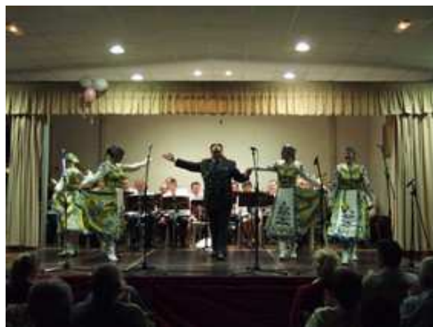
Quelques danseuses du groupe 'Les Musiki »