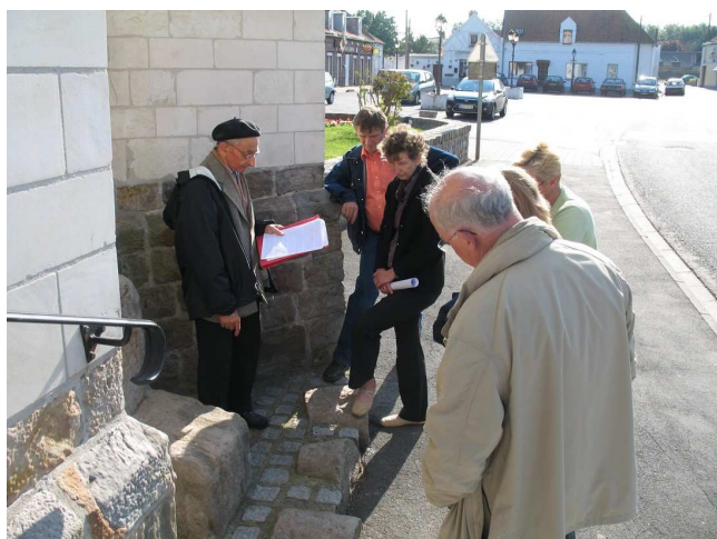
Devant le « siège de justice »

Samedi 20 Septembre, un petit nombre de Verquigneulois s'étaient donné rendez-vous près de l'église afin de participer à un circuit découverte du patrimoine de la commune.