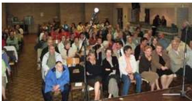
Des spectateurs enchantés par les musiciens du Bélarus pour la 4ème année à Verquigneul