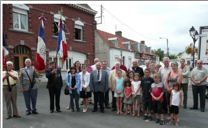
14 Juillet au Monument aux Morts