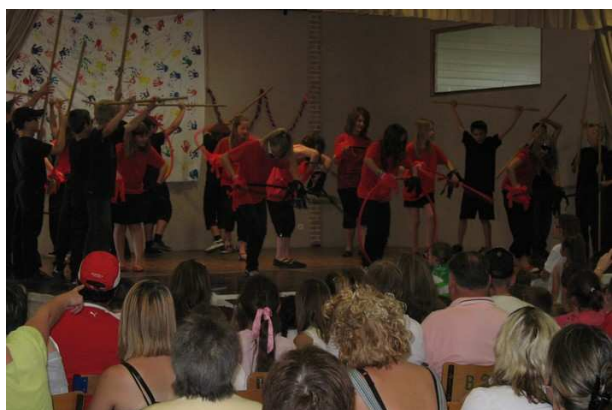
26 Juin : Fête des Écoles