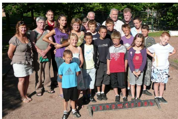
14 Juillet : Jeux au Parc de la Loïsne