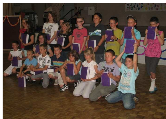
25 Juin : Remise des dictionnaires