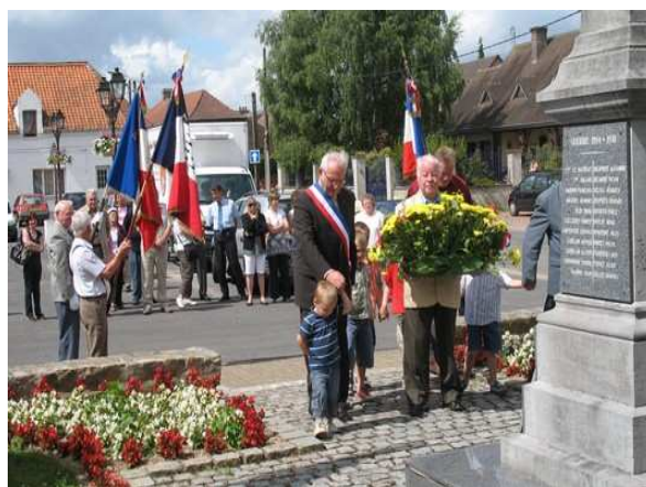
Au Monument aux Morts le 14 juillet

A midi, une gerbe a été déposée par Monsieur le Maire, les conseillers et les porte-drapeaux au Monument aux Morts avec l'aide des enfants présents pour l'occasion. Un vin d'honneur était offert par la municipalité dans la Salle Polyvalente pour l'occasion, assorti d'une distribution de friandises pour les enfants.