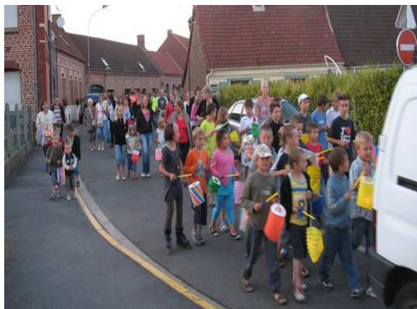
Retraite aux flambeaux

Les festivités du 14 juillet ont débuté par la retraite aux flambeaux le 13 juillet. Les enfants et leurs accompagnateurs, une centaine de personnes, ont défilé dans les rues du village jusqu'au Parc de la Loisne où une distribution de friandises attendait les participants.